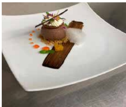
Schoggi-Kreation von Ramona, 5. Platz von 65 Teilnehmenden